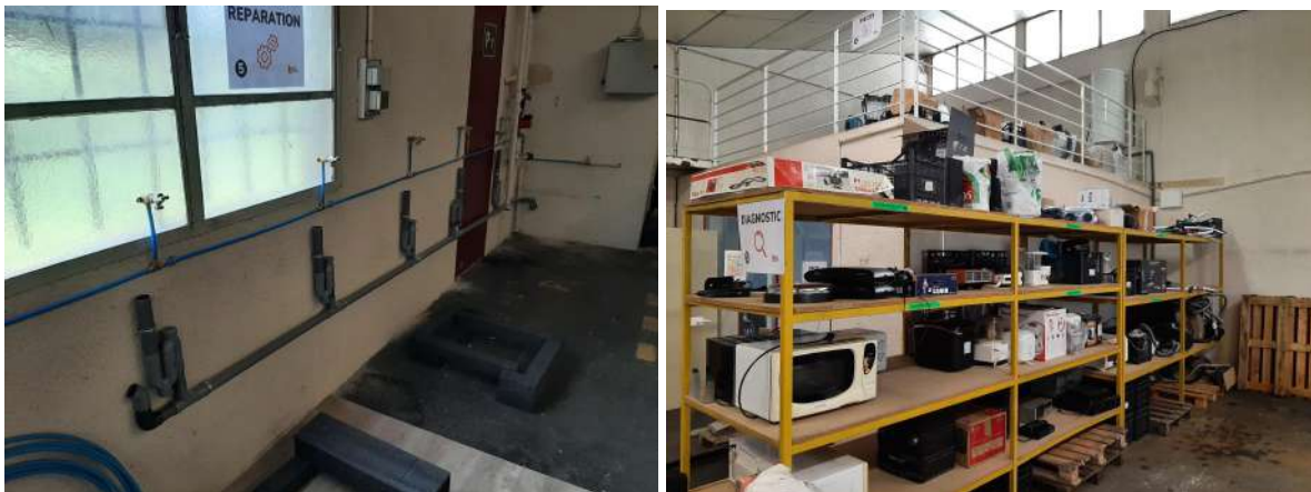
Photo 2 : zone de réparation et test GEM (début janvier 2023) - stockage produits à diagnostiquer (étagère) et pièces détachées (mezzanine)